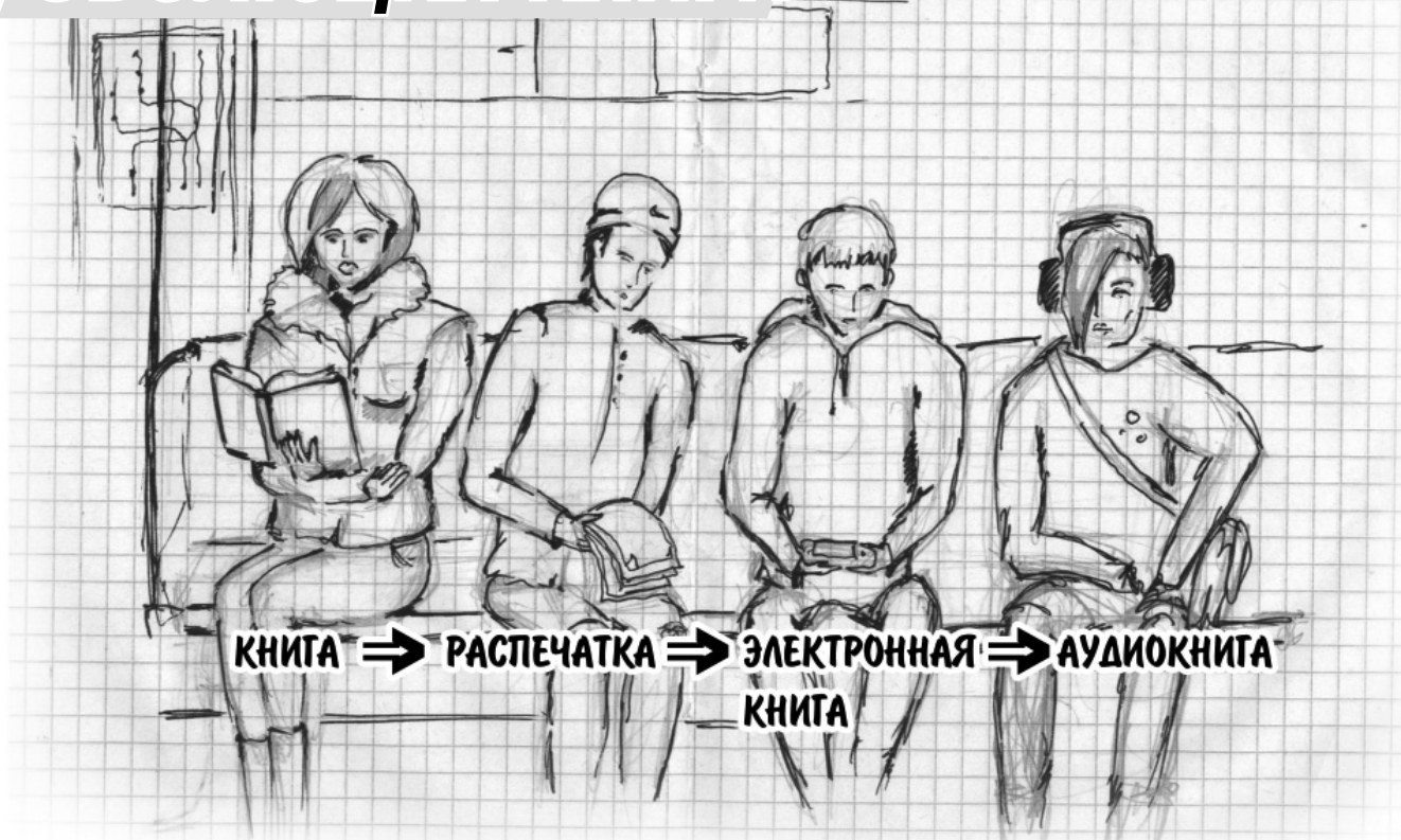
Рисунок Владимира Беженцева